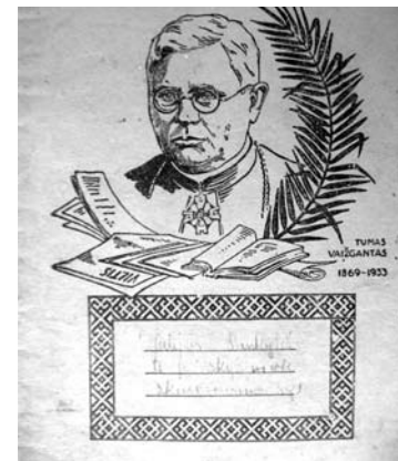
Tarpukario Lietuvos mokinukai rašydavo į sąsiuvinus, papuoštus patriotiškumągandančiais paveikslėliais.