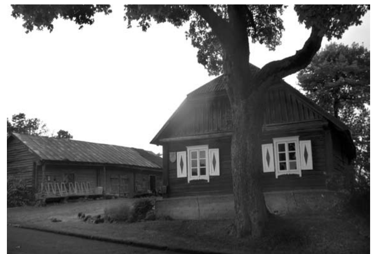
Senosios Kunigiškių „ūlyčios“ idilė...